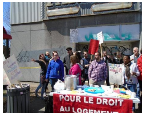
Action devant le cinéma Paradis