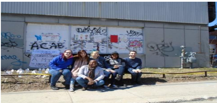
Étudiant(e)s PIC 2016

Dans le cadre du cours Action communautaire du programme de technique en travail social, les étudiant(e)s de Marie-Victorin sont appelés à choisir un organisme communautaire afin de faire un projet d'intervention communautaire (PIC). Infologis a reçu un groupe de 6 étudiant(e)s qui ont choisi de faire une action de revendication de terrain sur les terrains de l'ancien cinéma Paradis laissé à l'abandon depuis une dizaine d'années. L'action s'est insérée dans la campagne pour une réserve de terrains et bâtiments déjà en place et menée par le FRAPRU. Les Étudiant(e)s ont ciblé ce site situé au cœur de Mercier-Est afin de demander aux citoyens/citoyennes ce qu'ils et qu'elles aimeraient trouver à cet endroit plutôt qu'un vieux bâtiment abandonné. Une cinquantaine de petites maisons en carton avec un souhait pour le bâtiment ont été plantées et les souhaits ont ensuite été envoyés au maire Coderre. Un rassemblement d'une cinquantaine de personnes sur le site. Infologis considère le projet comme un succès car il a été réalisé localement, les citoyens de Mercier-Est ont été directement consultés et le projet se collait bien avec les couleurs de l'organisme. Merci à l'équipe PIC 2016.