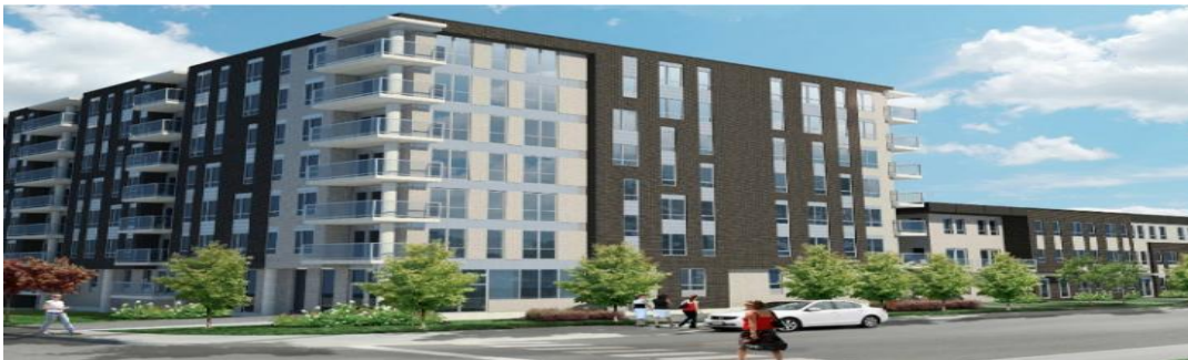
Bâtiment A de la coopérative de solidarité Fusion verte

Malgré toutes ces coupures, certains projets ont pu avancer. En 2016-2017 on aura assisté à la livraison de la coopérative de solidarité « Fusion verte » au Faubourg Contrecoeur. Cette coopérative 247 logements est une démonstration parfaite d'une cohabitation entre des familles et des personnes seules. Notre organisme s'est beaucoup impliqué dans la réalisation de cette coopérative, notamment en siégeant sur le conseil d'administration durant toute la phase de réalisation.